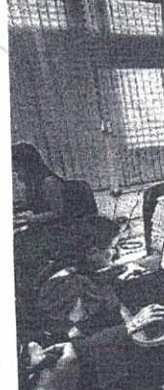
Equipe realiza 1 e seguir.

“A nossa intenção é criar um ambiente apropriado dentro da unidade para que o juiz responsável possa futuramente gerenciar o acervo e garantir à sociedade que há sintonia nos interesses do Poder Judiciário em atender as demandas de Imperatriz”, afirmou.