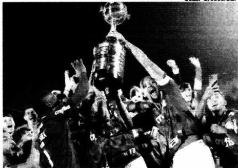
Jogadores do Palmeiras levantam troféu da Copa Libertadores em Montevidéu

O Palmeiras, que no sábado conquistou seu terceiro título da Copa Libertadores, enfrentará o vencedor do duelo entre o campeão africano, Al Ahly, do Egito, e o vencedor da Liga dos Campeões da Concacaf, Monterrey, do México, na semifinal do Mundial de Clubes, após sorteio realizado nesta segunda-feira.