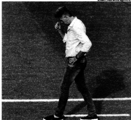
Renato Gaúcho durante a final da Libertadores entre Palmeiras e Flamengo