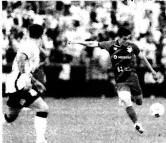
Athletico Paraná está em 14º lugar

Na tarde do último domingo, o Athletico visitou o Corinthians e acabou derrotado por 1 a 0, resultado que deixou o time com o sinal de alerta ligado.