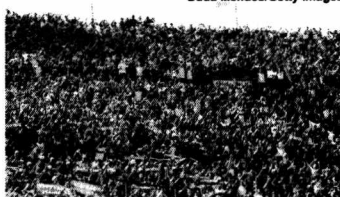
Policia uruguaia descarta que ataque tenha sido feito em briga de torcidas brasileiras

A Polícia do Uruguai investiga um ataque a tiros sofrido por um torcedor do Flamengo no Barrio Sur, região localizada ao sul de Montevidéu, capital do país vizinho onde foi disputada a final da Copa Libertadores da América, vencida pelo Palmeiras na prorrogação.