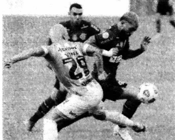
Flamengo e Ceará empataram em 1 x 1 no turno

Nesta terça-feira (30), Flamengo e Ceará se enfrentam no estádio do Maracanã, às 20h (Horário de Brasília), em duelo que é válido pela 36ª rodada do Campeonato Brasileiro.