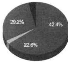
Quantidade de preços por item