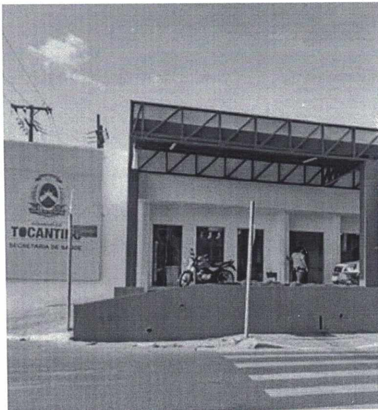
Mortes no HRA teriam ocorrido pelo bloqueio