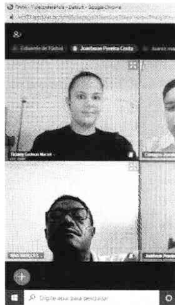
A mediação do Núcleo para o avanço da

O passo seguinte será a assinatura de um Termo de